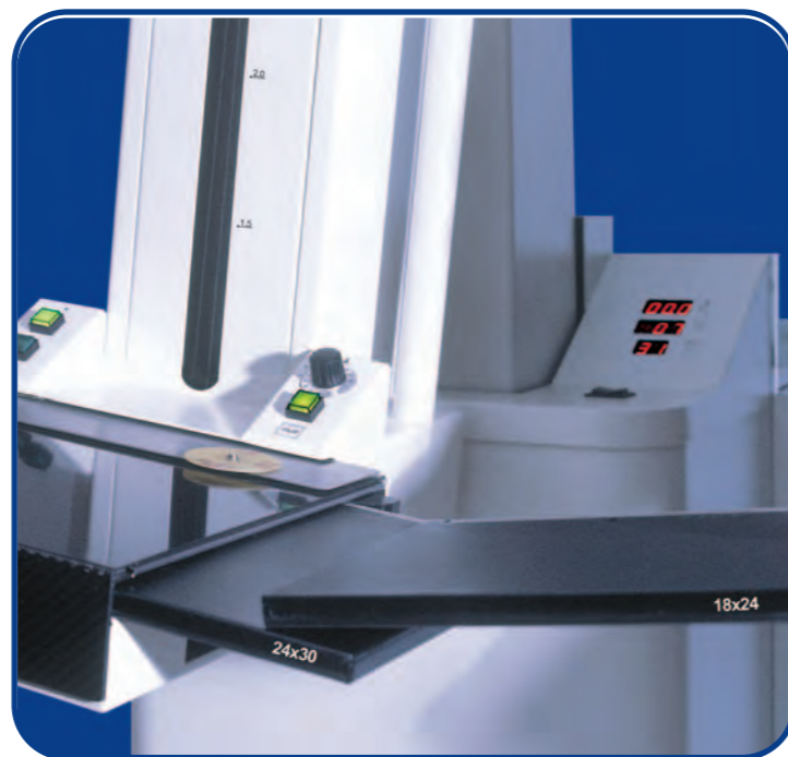
Unico potter per entrambe i formati: 18X24 e 24X30 One potter two formats: 18X24 and 24X30