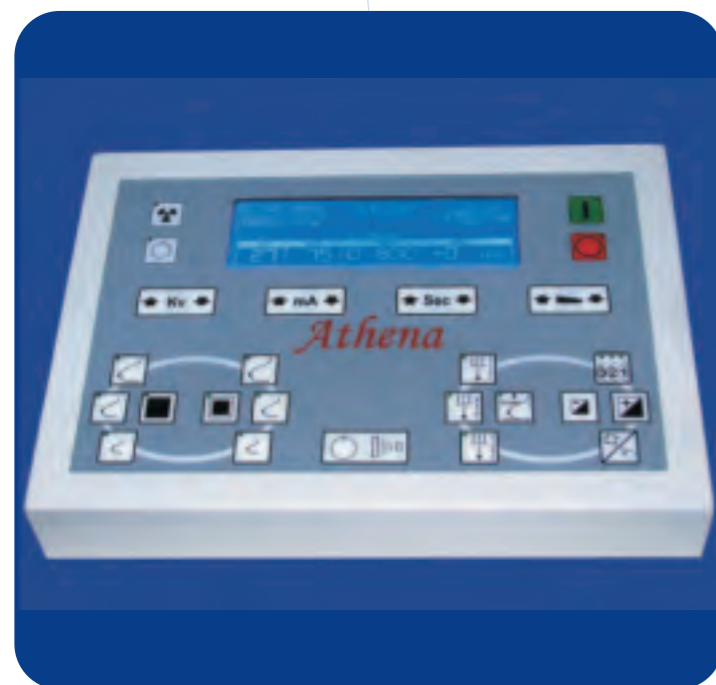
Consolle di comando - Control console

The device has also a serial interface for image printer. We are sure that new Athena will let you surprised and that it will be your new Mammography device.